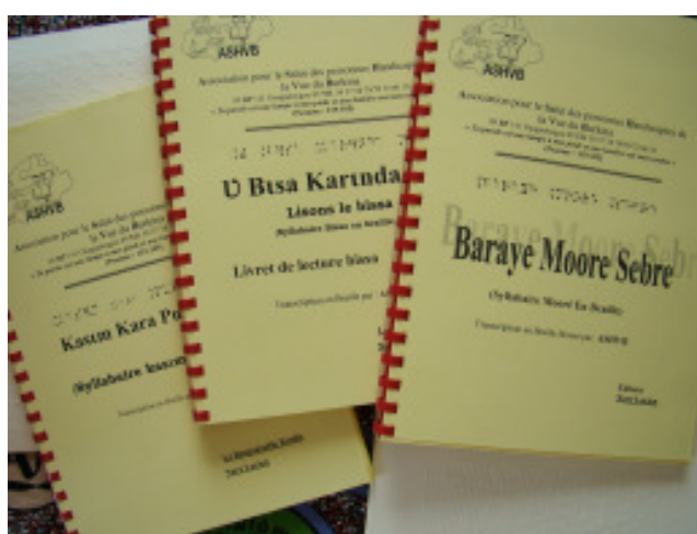
Syllabaires en langues vernaculaires du Burkina Faso

Les méthodes brailles seront utilisées pour alphabétisation bilingue et l'apprentissage du braille dans des lieux de formation et d'éducation que montrent ces deux autres projets :