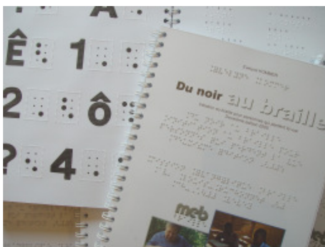
Abécédaire «Du noir au braille» en français, Méthode de base pour le braille.

Budget pour imprimer 5000 méthodes braille en 3 techniques d'impression à CHF 15.- : CHF 75'000.-